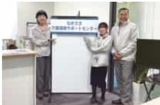
サポートセンタースタッフのみなさん。専門の相談員が常駐する。